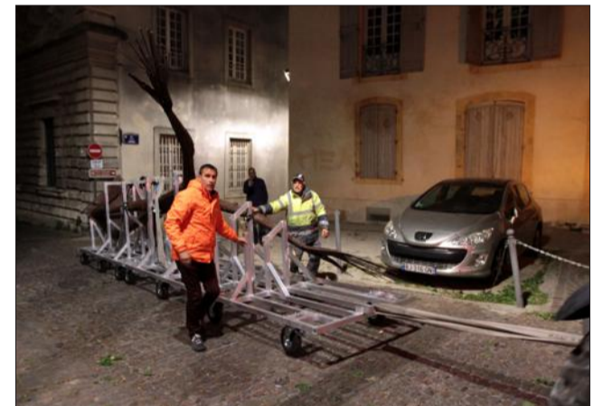
Un charriot a été spécialement conçu pour transporter l'oeuvre.