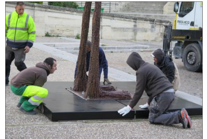
Un socle, lesté de béton, a aussi été créé pour l'occasion.

RETROUVEZ LA VIDÉO SUR vauclusematin.com