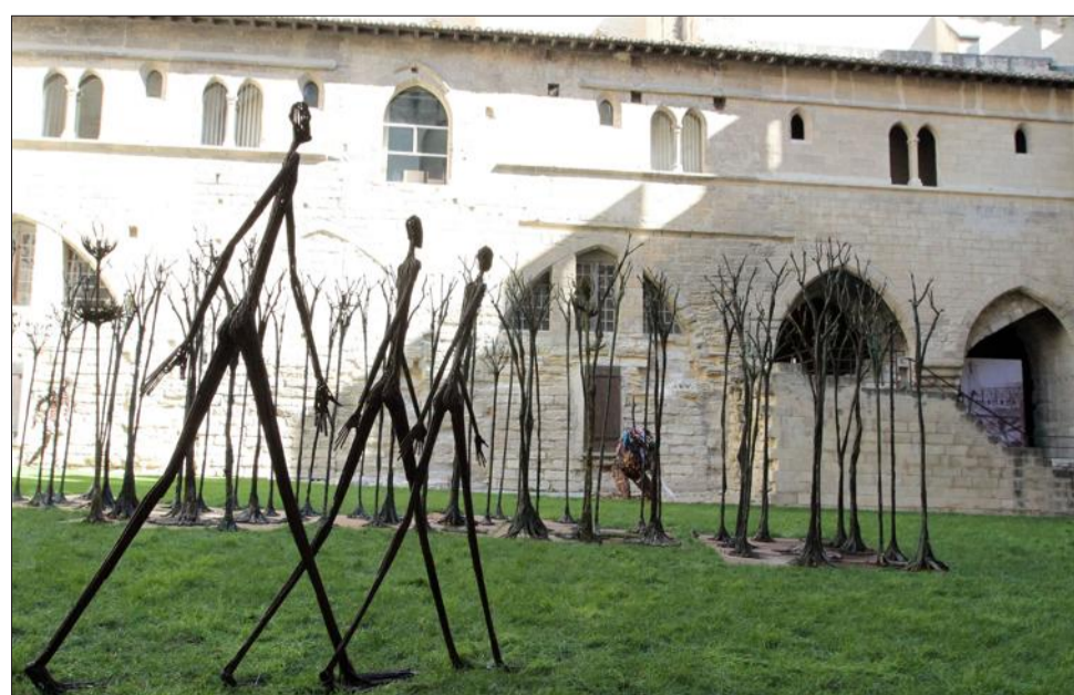
Les oeuvres du sculpteur Ndary Lo ont investi le cloître Benoît XII au Palais des papes.

Des oeuvres en bois ou en aluminium ornent aussi les galeries du cloître.