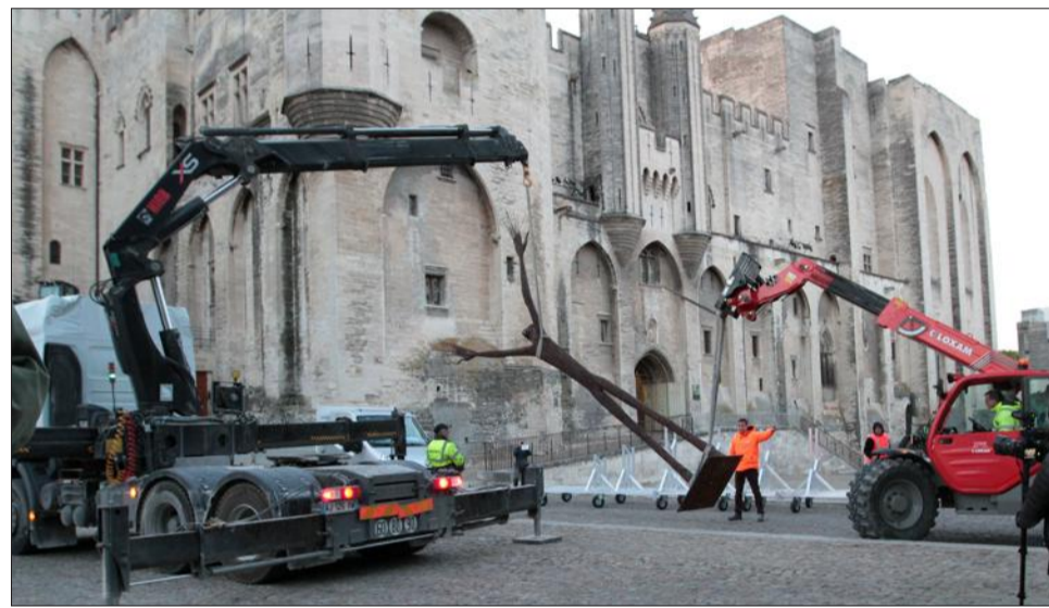
Il est 6 heures, en seulement quelques minutes, la sculpture de Ndary Lo est redressée.

L'arrivée de l'emblématique "Prière universelle", hier matin sur la place du Palais des papes, annonce la grande exposition d'art contemporain de la fondation Blachère. Baptisée "Les Éclaireurs, sculpteurs d'Afrique", cette manifestation doit se dérouler du 19 mai prochain au 14 janvier 2018 (en Repères).