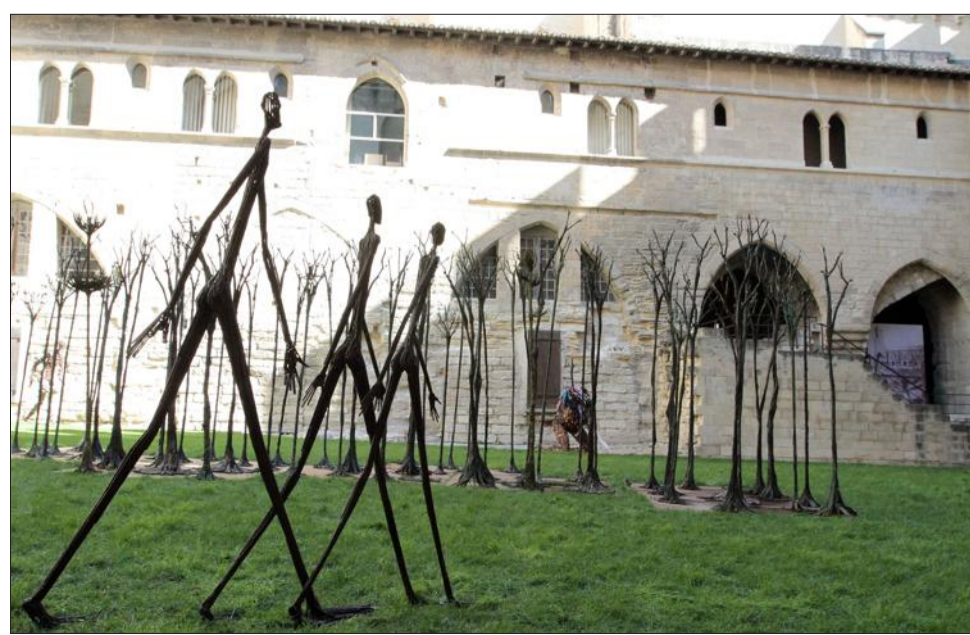
Les oeuvres du sculpteur Ndary Lo ont investi le cloître Benoît XII au Palais des papes.

Des oeuvres en bois ou en aluminium ornent aussi les galeries du cloître.